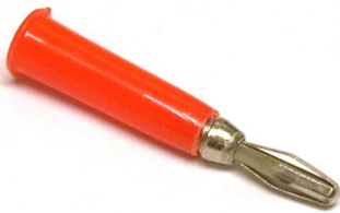
PLUG BANANA ROJO