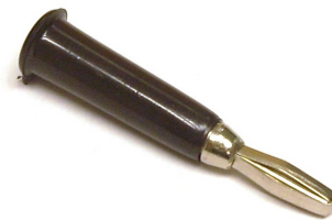
PLUG BANANA NEGRO